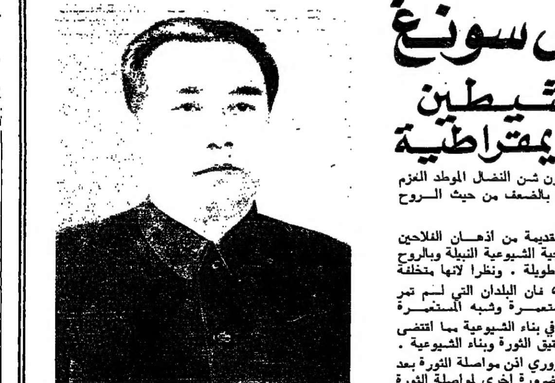
الرئيس كيم ايل سونغ

تشجيع جنازة عضو مجلس قيادة الثورة المصري السابق شيعت في القاهرة امس جنازة يوسف منصور صديق عضو مجلس قيادة الثورة المصري السابق، الذي تولى امس الاول في مستشفى القوات المسلحة بالمعادي بعد مرض طويل.